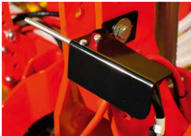
Датчик подъемного механизма верхней тяги